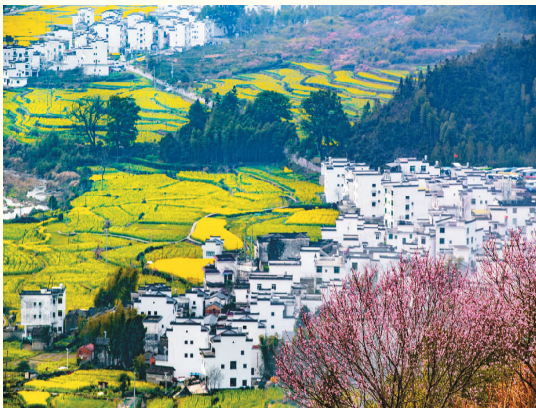
上图：江西省上饶市婺源县油菜花绽放。 左下图：安徽省黄山市歙县石潭村，云雾缥缈，风景如画，游人如织。 右下图：安徽省芜湖市繁昌区孙村镇中分村出现平流雾景观。