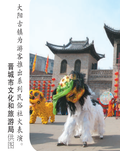
大阳古镇为游客推出系列民俗社火表演。

大阳镇还将民间文化艺术送进校园、社区、乡村，年均送文化艺术下乡活动22场，受益群众近5万人次。当地以20位村级文化管理员为抓手，6个重点村为主体，成立6支文艺小分队，结