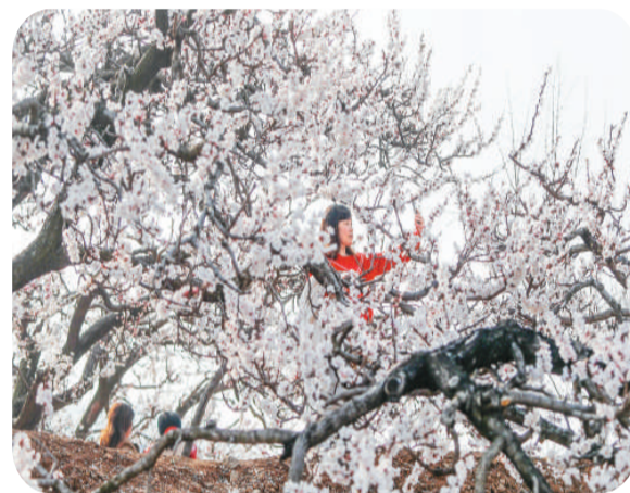
相山区黄里村杏花绽放。

近年来，相山区借势“新春第一游”的杏花节，不断发展踏青赏花游、美丽乡村游、民俗体验游，深入推动农旅融合发展，依托特色产业，推进生态农业、观光农业、特色产业，逐步形成各产业联动的发展格局。该区通过建立“旅游区+观光+采摘园+企业+农户”的联动模式，促进了现代农业和旅游业的结合，实现了传统农业向现代休闲农业转型发展的新突破。国家地理标志产品黄里笆斗杏也因活动走进大众视野。