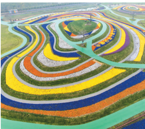
江苏省南通市重点文旅项目洲际梦幻岛美丽景色。

中华大地色彩缤纷，好似彩虹散落于人间。唯愿此去经年，时光不吝，踏遍千山万水，共赏大地韶光。