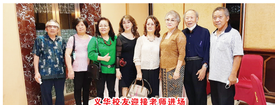
义华校友迎接老师进场

【本报讯】众所周知，万隆原义华小学学生毕业后继续到万隆中学校上学，然学生们对母校义华小学的思念永存，成功立业的校友支持赞助母校的活动。