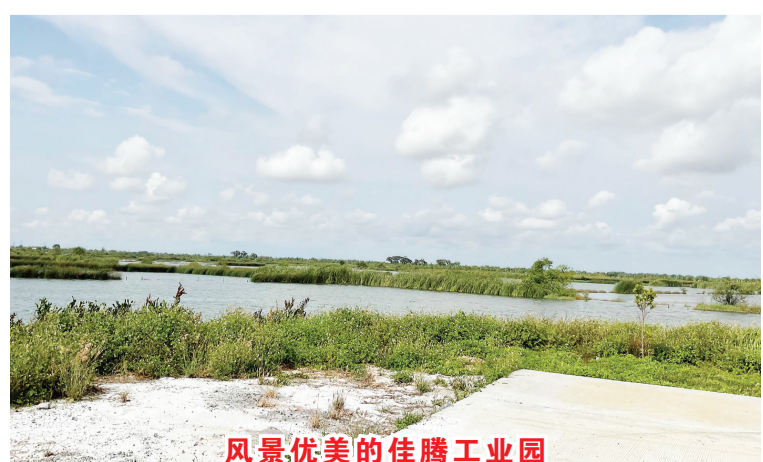
风景优美的佳腾工业园