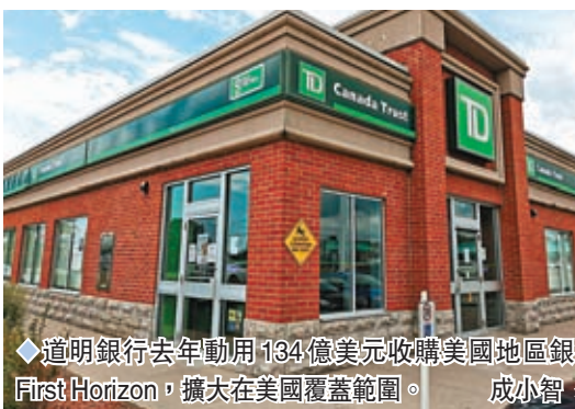
◆道明銀行去年動用134億美元收購美國地區銀行First Horizon，擴大在美國覆蓋範圍。

最可取是穩步前進，不會像美國銀行業承受過度風險。故此，分析師總結加拿大銀行業的財務狀況是受到控制，不會爆發風暴。長期以來，加拿大各大銀行的資本比率遠高於監管當局訂立的最低水平。 德索薩表示加拿大銀行存戶深信國內銀行安穩健全是非常重要的，存戶不會貿然因風吹草動而一窩蜂湧到銀行提款，保障銀行不會在面對擠提下被迫變賣資產，甚至最終倒閉收場。