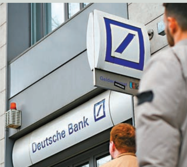
◆德意志銀行股價24日盤中跌幅一度超過14%。

現時德意志銀行CDS風險溢價已從上周三的142個基點，驟增至24日的208個基點，達到2018年底以來峰值，引發投資者密切關注。 《福布斯》：風險控制薄弱與瑞信相若 財經雜誌《福布斯》亦指出，德意志銀行常年風險控制薄弱、醜聞眾多，幾乎與近日深陷破產危機後被收購的瑞信相若。過去十多年間，德意志銀行股價不斷下跌，從未回升至2007年4月的峰值，至今累計跌幅已逼近95%。 朔爾茨24日則堅稱，德意志銀行已從根本上完成商業模式的現代化重組，如今盈利豐厚。他亦強調歐盟對銀行監管設有嚴格規則，歐洲銀行系統現時穩定且具有彈性。 ◆綜合報道