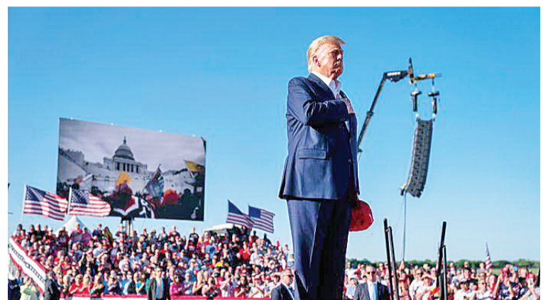
美国前总统特朗普25日在得州瓦科举行大规模竞选集会。

表演,拉开了特朗普2024年共和党总统竞选的第一次大规模集会的序幕。然后,特朗普发表了一篇“充满怨恨”的演讲,并将包括纽约大陪审团调查在内的调查定性为“对他和他的追随者的政治攻击”,目的是阻碍他参加2024年总统竞选。