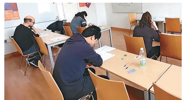
日前，奥地利维也纳大学孔子学院顺利举办2023年首场汉语水平考试，考生们参加了一级到六级的汉语水平考试以及汉语水平口语考试（初级）。图为考试现场。