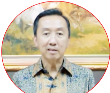
泛印银行董事长翁扬周视频致词