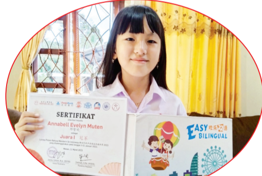
获奖学生与教学奖品