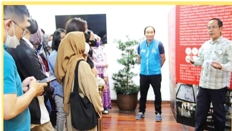
学员们聆听有关华人历史资料

学生团队在华族历史纪念馆参观印尼华族历史,获得李振山与理事介绍详情并得到有关书本。 万隆侨中校友供稿