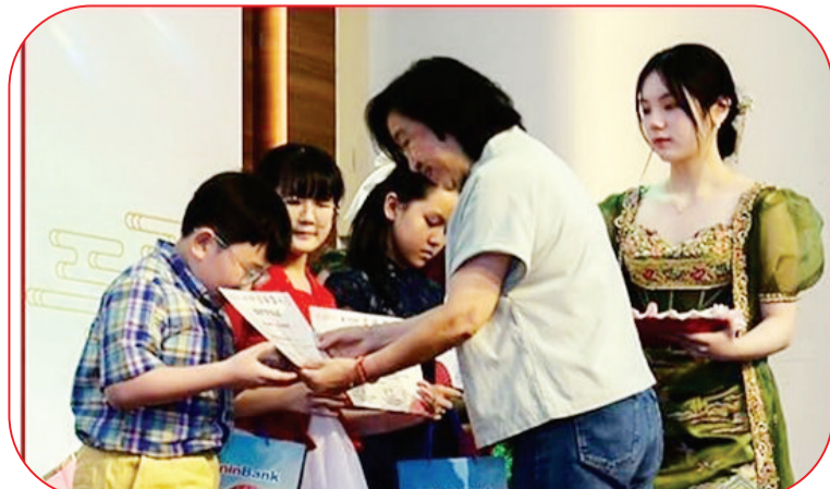
为优秀学生发奖景