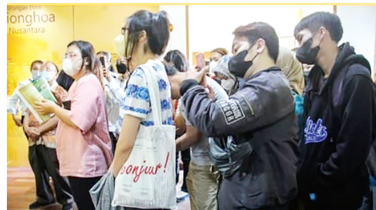
学员们聆听有关华人历史资料

【本报讯】2023年3月13日,星期一,万隆国际外语学院50多名学生在曾院长的带领下参观了渤良安基金会属下的印尼华族历史纪念馆,给学生们进行了华族文化史的介绍和教育,了解了目前还不为大众所知的印尼华族对本土的文化、教育、建设、建国、独立、改革、民族尊严的伟大贡献。