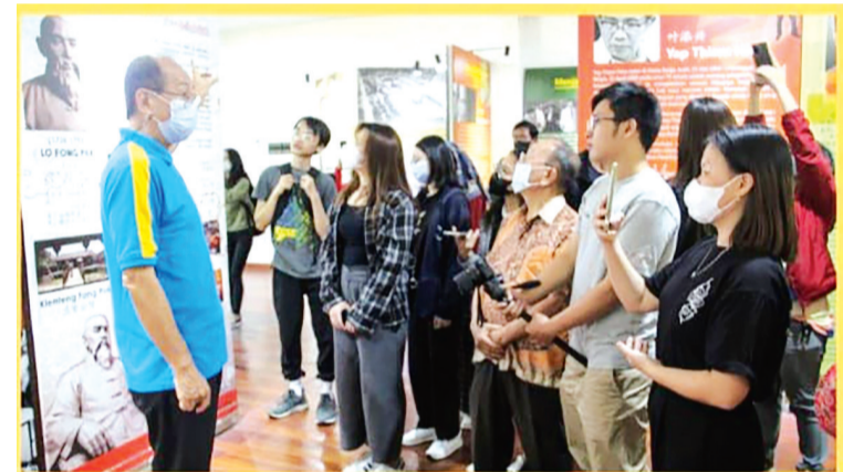
学员们聆听有关华人历史资料1