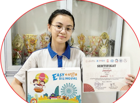
获奖学生与教学奖品