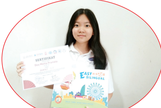
冠军奖 - Education 21 Pekanbaru