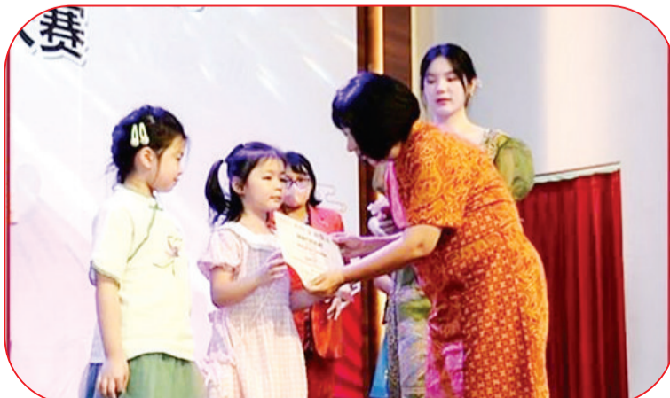
为优秀学生发奖景