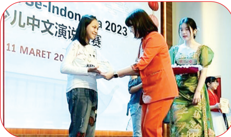
为优秀学生发奖景