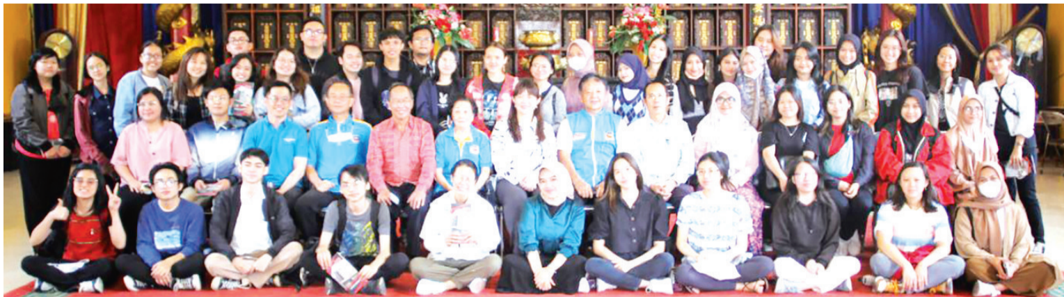
学生团队参观百氏祠后与渤良安理事合影。