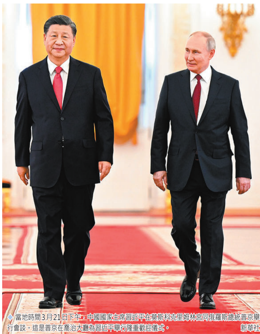
當地時間3月21日下午，中國國家主席習近平在莫斯科克里姆林宮同俄羅斯總統普京舉行會談。這是普京在喬治大廳為習近平舉行隆重歡迎儀式。