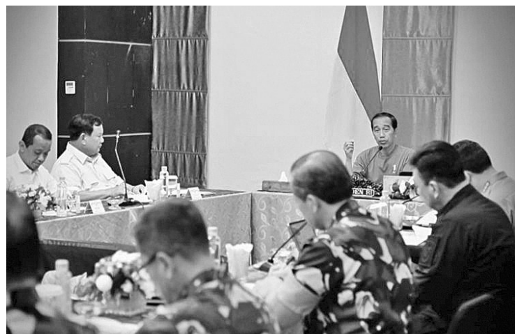
佐科维总统在巴布亚主持局部内阁会议

【本报讯】3月20日晚上，佐科维总统在巴布亚主持了一项局部内阁会议，出席会议的相关官员包括总警长里斯提约将军、国军总司令尤托·玛戈诺诺海军上将、国防部长普拉波沃、国家情报局主任布迪·古纳万、总统府办公厅主任穆尔多科与投资部长兼投资统筹机构主任巴赫利尔。