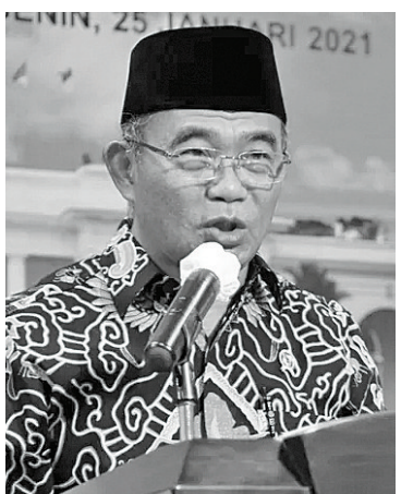
青年与体育部代理部长穆哈吉尔·埃芬迪

U-20世界杯将于5月20日至6月11日在我国举行。这次比赛，包括以色列在内的24支国际球队将参加比赛。(亮剑)