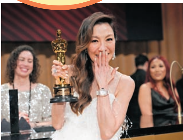
楊紫瓊成奧斯卡首位亞裔影后。