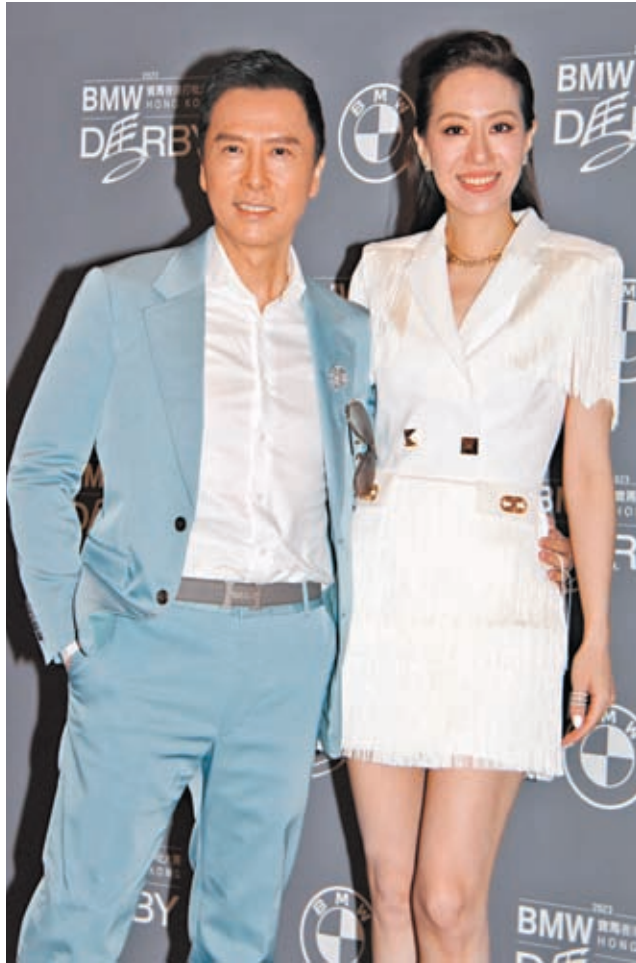
甄子丹與太太汪詩詩出席沙田馬場活動。

近期忙於搬屋的湯怡明顯消瘦，她坦言不能接受自己肌肉鬆弛，所以一直有保持做運動。相反，湯怡就不追求老公要有線條，說：「其實他什麼身形都不介