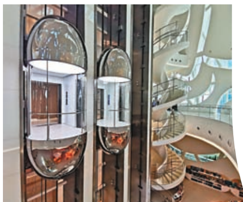
館內設有一條蜿蜒曲折的白色樓梯及時空膠囊般的電梯，貫穿了建築的7層樓。