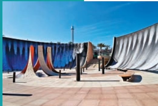
Surreal超現實水景，配合音樂演奏，瀑布更美。