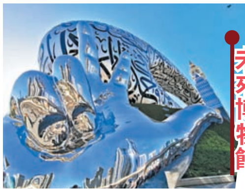
博物館的這個手勢裝置吸引遊客拍攝。