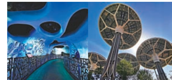
Under the Ocean 館外設置了能源樹。

2020年，本是杜拜舉辦世界博覽會的日子，後來因疫情延後一年至去年3月舉行，當世博會閉幕後，多個展館被保留，場地改建打造成「杜拜世博城」(Expo City Dubai)，去年10月正式開放，大家現在已可進入參觀，世博城之大，讓你逛足一天。這裏是一個以未來為中心的迷你城市，以2020杜拜世博會（中東、非洲和南亞地區的首個世博會）為基礎建造而成，它們承載了無數美好的世博記憶。