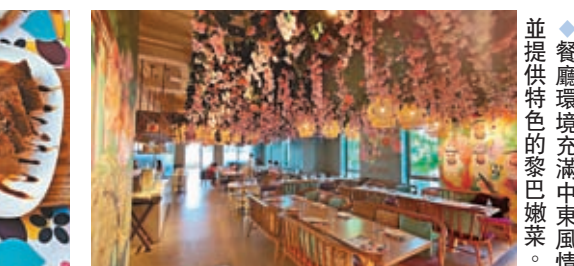
餐廳環境充滿中東風情，並提供特色的黎巴嫩菜。