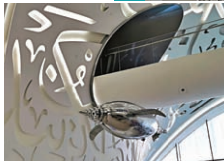
筆者在離開博物館前，看到機械豚在表演。