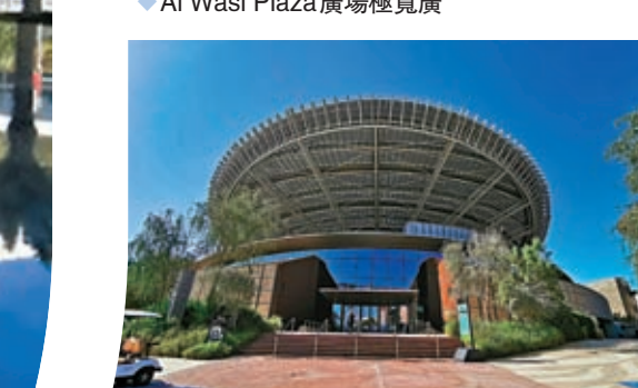
Terra可持續發展館外觀