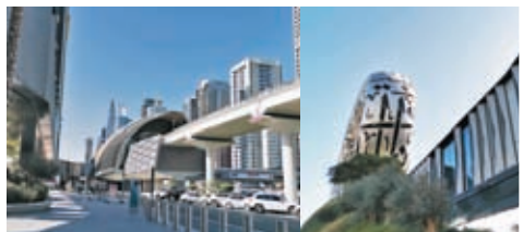
博物館鄰近地鐵站，備有天橋直達。