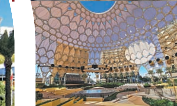
Al Wasl Plaza廣場極寬廣