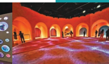
第三展區「綠洲」，是一個冥想空間。