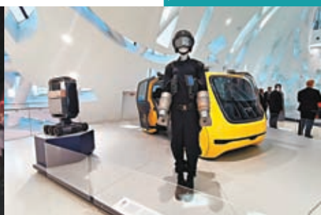
你可以在此展區看一系列新技術。