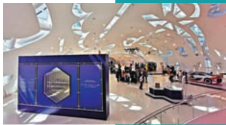
離開「Journey to the future」後，便到「Tomorrow Today」展區。