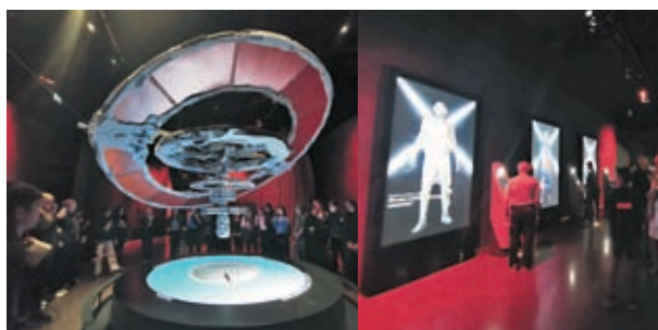
第一展區：國際空間站，你可以體驗變身太空人的影像。

最後階段「綠洲」是一個冥想空間，布置得很有阿拉伯特色，你可走到如沙的地方，沉浸在音樂中放鬆身心。至於「Tomorrow Today」一區帶領大家發現新技術將如何改變我們的生活，並展示了人類在最近幾年的熱門研究領域中取得的一系列成就，如自動駕駛汽車和噴氣背包等。同時，海洋生物飄在空中，或無數飛行器在高樓大廈間飛速穿梭。而「Future Heroes」則專為孩童設置，透過互動遊戲和與他人合作，具想像與創造力。