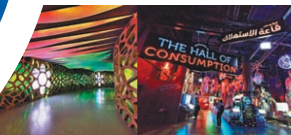
館內尾端部分色彩繽紛，可供打卡。