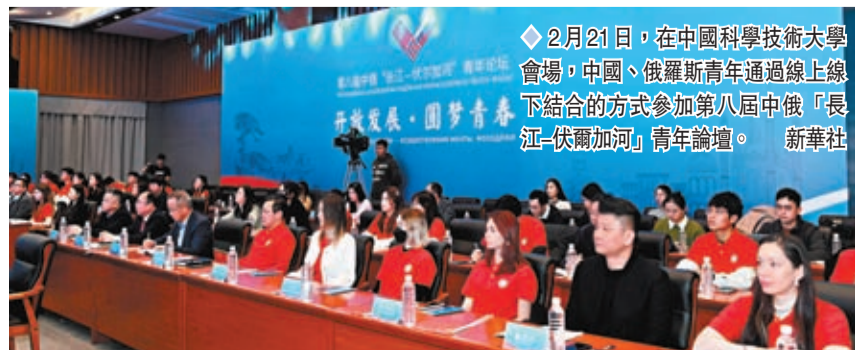
◆2月21日，在中國科學技術大學會場，中國、俄羅斯青年通過線上線下結合的方式參加第八屆中俄「長江-伏爾加河」青年論壇。