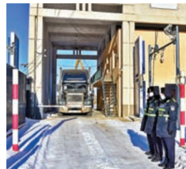
◆金燦榮預料，中俄將有望進一步擴大經貿合作。圖為黑龍江鶴崗，俄羅斯籍貨車正駛入中國境內。

目前俄烏雙方仍在「磨拳擦掌」，不斷增加兵力和武器。金燦榮指出，中國領導人此行是和平之旅，是去為烏克蘭問題勸和促談的，相信大部分中立國家也會對此表示歡迎。他相信，習近平主席此行將繼續為政治解決烏克蘭危機發揮建設性作用。