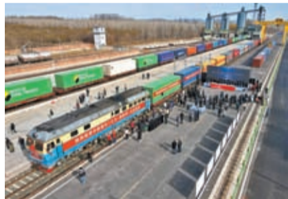
◆3月16日，從北京地區首發的中歐班列從北京平谷馬坊站駛出，預計運行18天左右抵達俄羅斯首都莫斯科。圖為發車儀式。