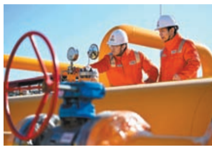
◆在中俄東線中段天然氣管道河北廊坊永清聯絡氣站，技術人員對輸氣管道進行安全巡檢。