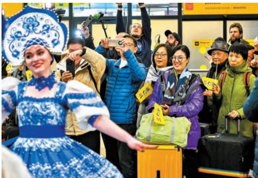
◆2月23日，俄羅斯迎來中國試點恢復出境團隊旅遊業務後的首批中國旅遊團。圖為在俄羅斯莫斯科的謝列梅捷沃機場，中國遊客觀看歌舞節目。資料圖片

文章最後指出，一年春作首，萬事行為先。我們有理由期待，作為發展振興道路上的同道人，中俄兩國必將為人類文明進步作出新的更大貢獻。