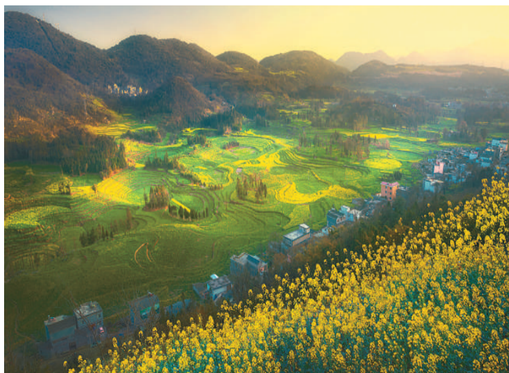
罗平牛街螺蛳田油菜花。

在滇东南一路走来，观山海风雨，叹天地无极，在这里，我感悟到了古老历史与现代人文的交织与融合。