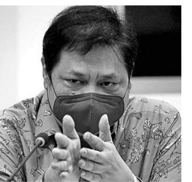
从业党总主席艾朗卡

事情。在国警刑事调查局技术工作会议中，里斯提约将军还向刑侦局警察成员传达了一些重点指示，以便适当地履行其职责。其中涉及采矿犯罪、森林和陆地火灾、常规犯罪、针对妇女和儿童的犯罪行为，以及反足球黑手党特遣部队、关于油气、腐败犯罪、处理央行援金资金的国家追债权、毒品犯罪、网络犯罪，提高法医化验中心、国家犯罪信息中心与印度尼西亚指纹自动识别系统中心的质量。(亮剑)