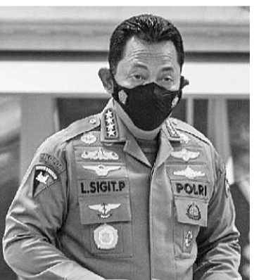
总警长里斯提约将军

【本报讯】3月15日，在西爪哇万隆举行的国警刑事调查局技术工作会议开幕礼上，总警长里斯提约将军命令国家警察刑侦局网络犯罪处在2024年大选之前，追踪社交媒体中的有关民族、宗教、种族和群体间的社媒内容。