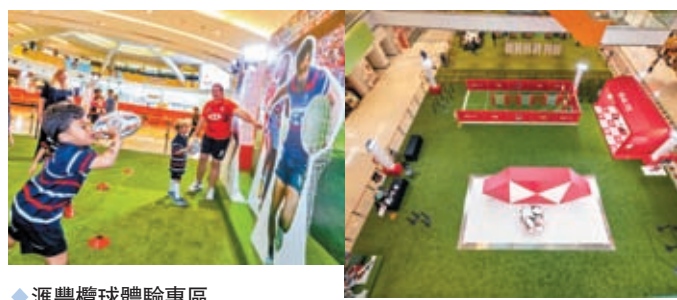
◆滙豐欖球體驗專區

年度矚目盛事「國泰滙豐香港國際七人欖球賽2023」將於3月31日至4月2日重臨香江，再次掀起全城七欖狂熱！為將欖球運動帶到社區，滙豐在荃灣D·PARK舉行「滙豐欖球體驗」推廣活動，一連串的活動讓小朋友與家長認識欖球運動。當中，如「滙豐欖球體驗專區」為小朋友提供一連串體驗活動，除了全港首個「滙豐室內非撞式欖球小學組四人賽」，滙豐更開辦多場「滙豐欖球體驗訓練班」及不同體驗活動予小朋友了解欖球運動，讓他們有機會親身經歷欖球員的訓練，希望培養小朋友對欖球的興趣，發掘未來欖球新星。