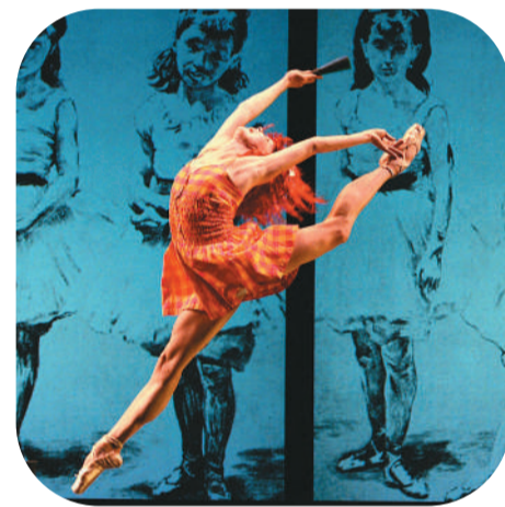
香港艺术节上的舞蹈作品《跣尖》剧照。

香港特区政府相关官员表示，香港享有中西文化荟萃的独特优势，特区政府将以艺术节等文艺盛事活动举办为契机，善用粤港澳大湾区丰富的文化资源，全力推动香港发展成为中外文化艺术交流中心。