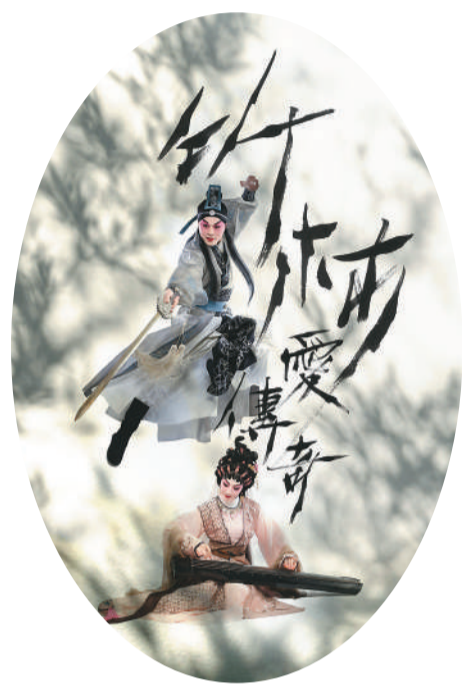
香港艺术节上的粤剧作品《竹林爱传奇》剧照。