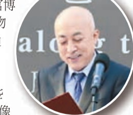
文化和旅遊部黨組成員、故宮博物院院長王旭東致辭。