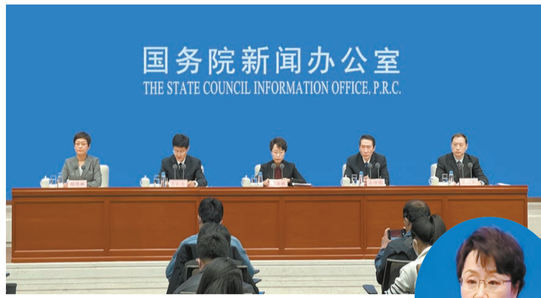
▲國新辦昨日舉行《新時代的中國網絡法治建設》白皮書發布會。記者相銘攝 ▶國家網信辦副主任曹淑敏。記者相銘攝

【香港商報訊】記者相銘報道：國務院新聞辦公室昨日發布了《新時代的中國網絡法治建設》白皮書，這是中國首次發布該領域的白皮書。國家網信辦網絡法治局局長李長喜在會上透露，針對近期社會高度關注的網絡暴力事件，去年11月，國家網信辦制定出台了《關於切實加強網絡暴力治理的通知》，攔截清理涉網絡暴力信息2875萬條，提示網民文明發帖165萬次，向2.8萬名用戶發送一鍵防護提醒，從嚴懲處施暴者賬號2.2萬個，有效防範熱點事件網絡暴力風險。未來，會推動制定更加完善的法律制度，強化對當事人的保護救濟。