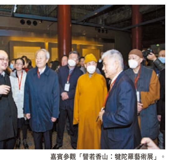
嘉賓參觀「譬若香山：犍陀羅藝術展」。

來，深受年輕人的喜愛，與行業及高校建立長期友好合作，近年來積極呼籲行業樹立文化自信，發揮民族文化價值，進一步提升時尚文化影響力，提升中國的時尚話語權。