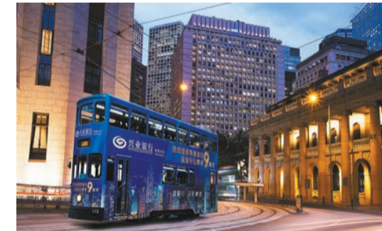
喜迎九周年行慶，襲一身興業藍的叮叮車馳聘在港島繁華的街頭。

由於香港特殊的國際金融地位，境外資金成本低、貸款用途廣泛等優勢明顯，集團重點聚焦深圳、廣州