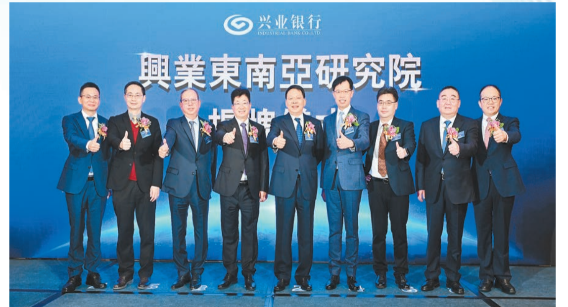
2023年2月22日，興業東南亞研究院在香港揭牌成立。