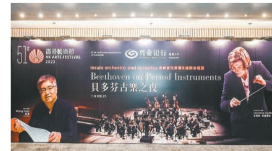
2023年2月25日，興業銀行香港分行特別冠名贊助的第51屆香港藝術節音樂會——貝多芬古樂之夜，在香港文化中心順利演出。

分行下轄總、分行級重點客戶的跨境融資需求，重點關注大灣區內城市軌道交通、港口建設、可再生能源、水力建設及污水處理等項目。