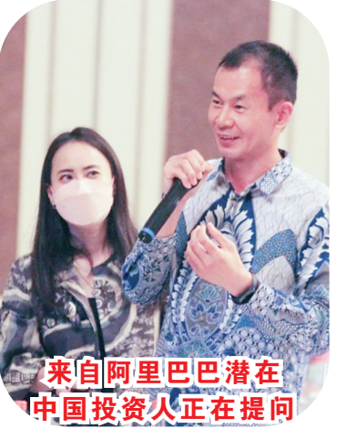
来自阿里巴巴潜在中国投资人正在提问