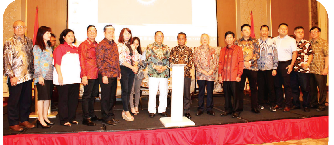
巴赫里尔与黄德新以及管理层一起出席印中智慧城市博览会启动仪式

他解释说:“刚才提问,政府对在印尼投资的保障是什么。过去办证难,我将保证办证易。办理许可证很简单,要料理采矿许可证(IUP)、对环境影响的分析(Amdal),位置许可证,都根据《创造就