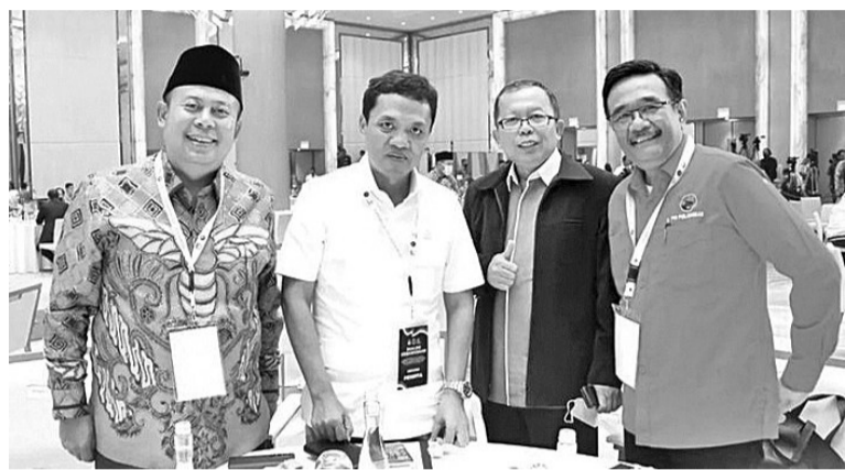
四大政党代表合影

强强联盟的机会仍然存在。他表示，其政党在前段时间与团结建设党、民族复兴党和印尼斗争民主党代表的会议上，确实谈到了仍在动态发展的政治局势。但是，还没有具体谈论“解禁节快乐联盟”的讨论。