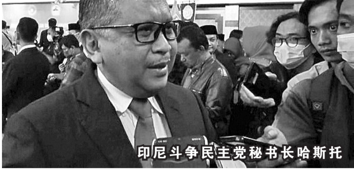
印尼斗争民主党秘书长哈斯托

【本报讯】印尼斗争民主党秘书长哈斯托表示，目前已经形成的党际联盟的版图仍会出现变化，各政党将在总统和副总统候选人的登记期之前面临现实问题。政治局势将发生转变，因为无论哪一个政党都有一个相