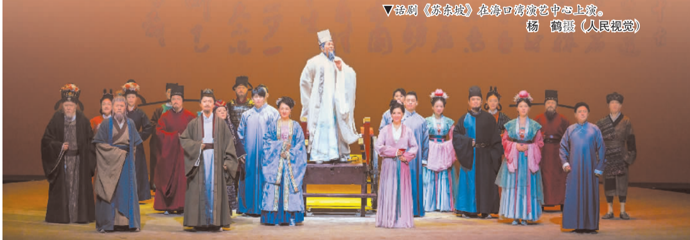
▼话剧《苏东坡》在海口湾演艺中心上演。