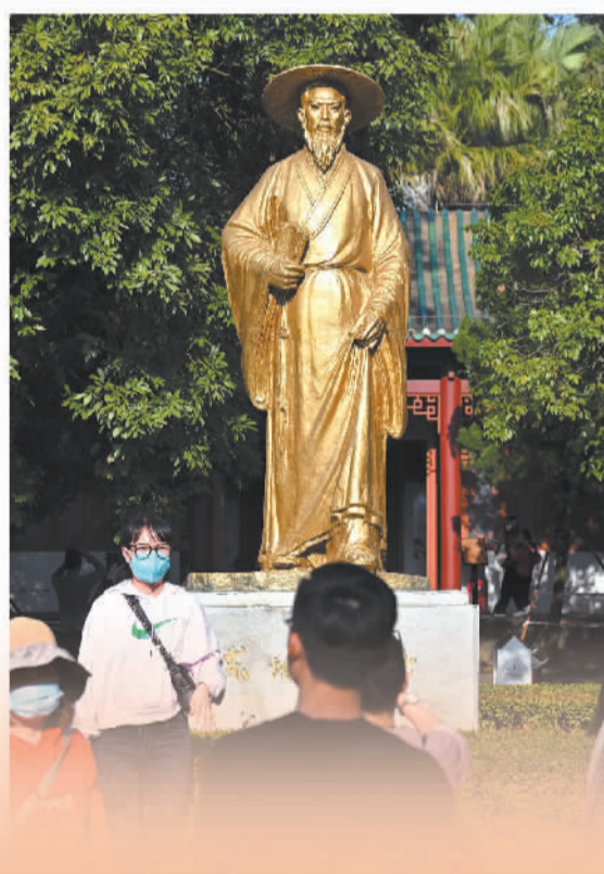
▲游客在儋州东坡书院游玩。