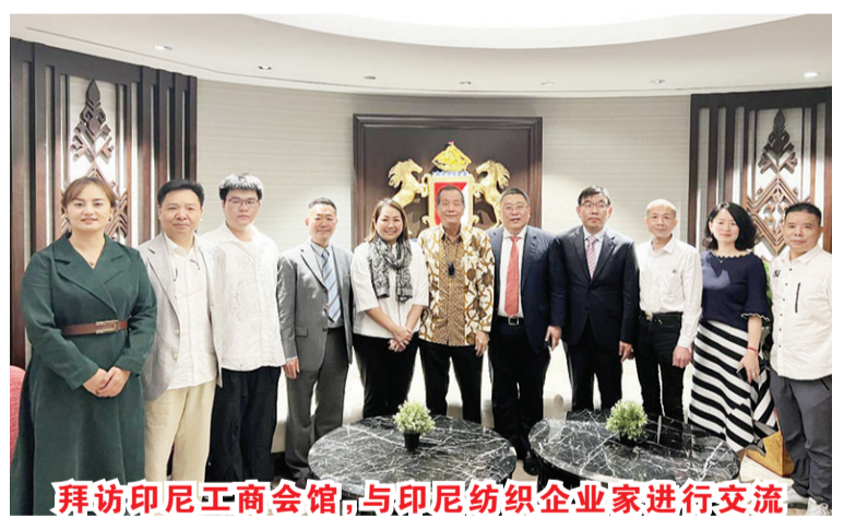
拜访印尼工商会馆,与印尼纺织企业家进行交流

爪哇梭罗、日惹和三宝壟,实地参观当地纺织企业工厂,了解设备和技术水平、劳动力成本和经营情况。在梭罗,考察团参观了Paramount集团旗下的PT. Danliris纺织工厂,该工厂成立于1974年,是一家覆盖纺纱、织造、印染、服装等棉纺领域的大型全产业链企业。在日惹,考察团先后来到了PT Mataram Tunggal Garment服装厂和PT Pan Brothers,与厂长及管理层的进行了交流,并探讨了投资合作的可能性。