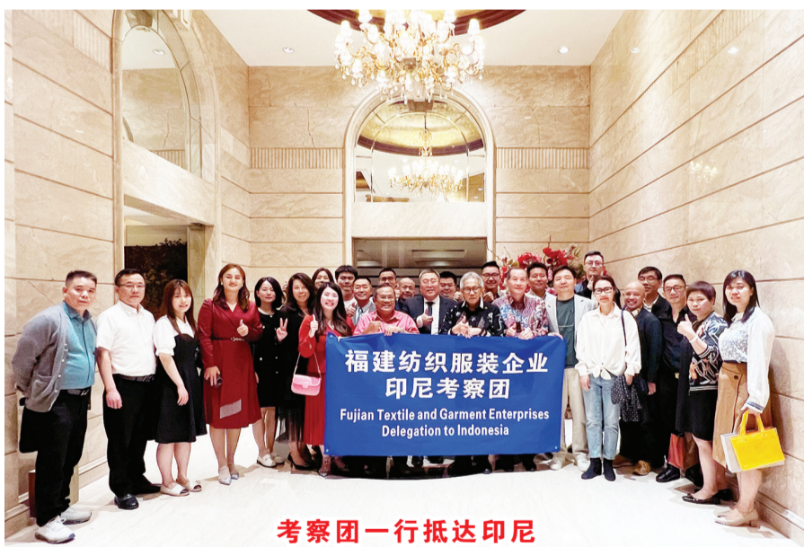
考察团一行抵达印尼

【本报讯】纺织服装业作为中国国民经济的传统支柱产业,在国家经济和对外贸易中占据着重要地位。福建作为中国纺织服装的主要生产和出口大省,拥有从化纤、纺纱、印染、服装等比较完善的产业链。截至2022年,福建省各类纺织服装企业达到2万余家,营收1267.17亿美元。而印尼也是全球十大纺织服装生产国,既有比较