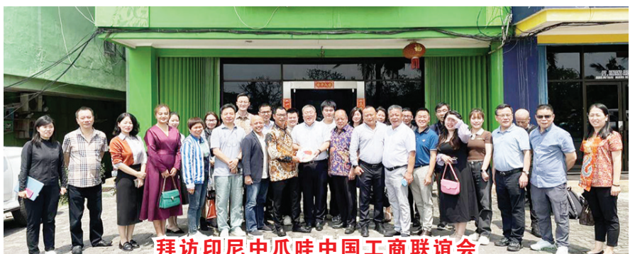
拜访印尼中爪哇中国工商联会