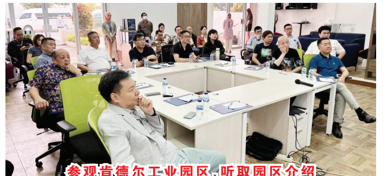
参观肯德尔工业园区,听取园区介绍