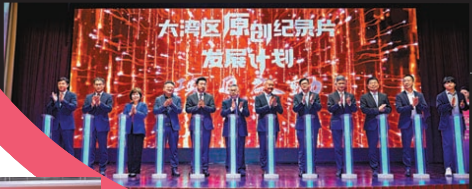
◆ 「大灣區原創紀錄片發展計劃」嘉賓登台進行啟動儀式。