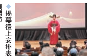
◆ 揭幕禮上安排表演環節。