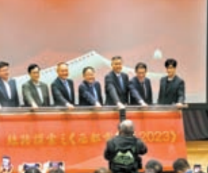
◆ 絲路探索之《西部電影展2023》14日舉行揭幕禮。