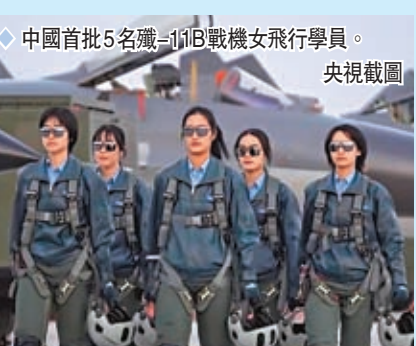
◆中國首批5名殲-11B戰機女飛行學員。 央視截圖

空軍西安飛行學院某旅副旅長邱林超指出，在未來作戰中，更注重武器平台的精準操縱，而女飛行員心細、鎮密、敏感的特點，使她們在武器操控、精密設備使用以及地形識別等方面，都有着更大的優勢，能更沉着冷靜、有條不紊完成作戰任務。