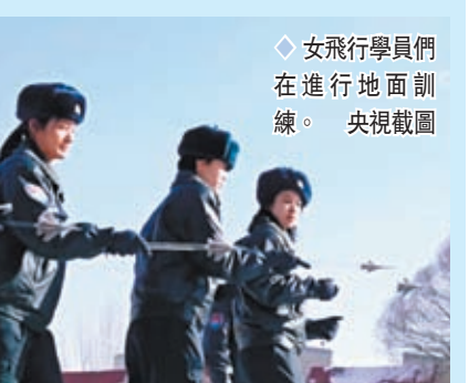
◆女飛行學員們在進行地面訓練。