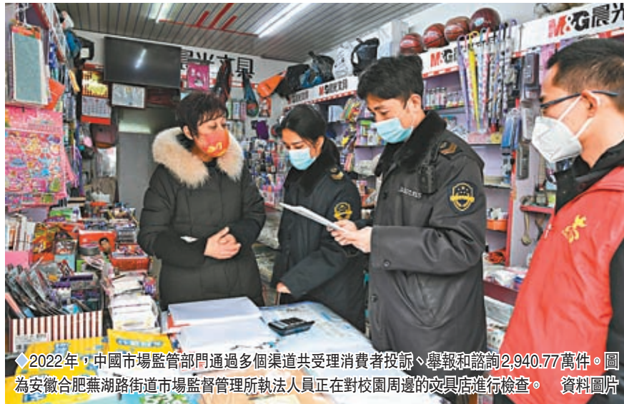
2022年，中國市場監管部門通過多個渠道共受理消費者投訴、舉報和諮詢2,940.77萬件。圖為安徽合肥無湖路街道市場監督管理所執法人員正在對校園周邊的文具店進行檢查。

近年來，「新消費」正成為經濟發展的「加速器」，一些侵權新情形與維權新難題也逐漸暴露，反映了消費維權的新痛點。例如，2022年，數字藏品（NFT）等新模式問題抬頭，監管難度加大，相關投訴5.97萬件（上一年僅1.98件），主要集中在不發貨、不退款、惡意哄抬價格、收取高手續費，隨意封禁消費者賬號等。「盲盒」熱潮下，消費者訴求高達4.14萬件，同比增長61.72%。