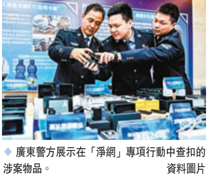
廣東警方展示在「淨網」專項行動中查扣的涉案物品。