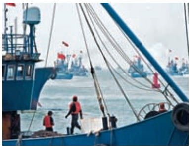
◆去年9月，黃渤海為期4個月的休漁期結束，漁船陸續出海開展秋汛捕撈作業。 資料圖片