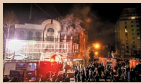
◆伊朗示威者2016年衝擊沙特駐伊使領館，放火焚燒建築物。 資料圖片

對於中國成功推動沙特和伊朗這兩個宿敵復交，美國智庫大西洋理事會中東計劃非常駐高級研究員傅爾頓表示，北京採取聰明做法，利用戰略夥伴關係在伊朗與沙特厚植外交，不像美國只會拉一邊打一邊。他認為，有別於美國