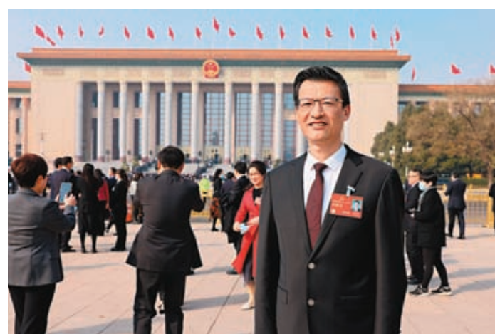
◆第十四屆全國人大代表方祝元