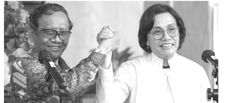
马福与穆丽亚妮召开记者会

政法安统筹部长马福 (左) 与财长斯里·穆丽亚妮 (右) 于3月11日在雅加达财政部办事处,向媒体公布关于财政部公务员非法交易事项后共同作出回应。财长要求金融交易报告和分析中心详细统计该300万亿盾非法交易额作为法律证据,以揪出涉案者。