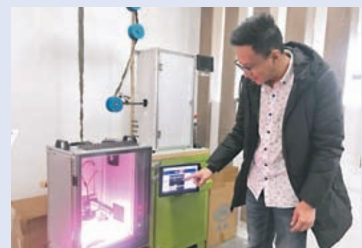
埃星智能科技有限公司研發的工業檢測平台。香港文匯報記者敖敏輝 攝

對於此次廣東省的數字政府2.0舉措，梁子斌十分看好。他舉例，當前中小企業創新研發十分活躍，但和大企業相比，中小企往往因渠道或資金有限，缺乏技術平台支撐。而根據此次新政，廣東將省市共建不少於30家數字政府信創適配測試中心，為中小微企業提供政務應用的信創技術攻關和適配測試服務，打造政務領域國產化芯片、操作系統、數據庫等典型優秀的應用場景技術解決方案。「有了這些平台，企業無需再另外投入資金、人力去搭建自己的技術研發、檢測平台。這條措施不但可以加速企業研發速度，亦有助企業降低成本。」