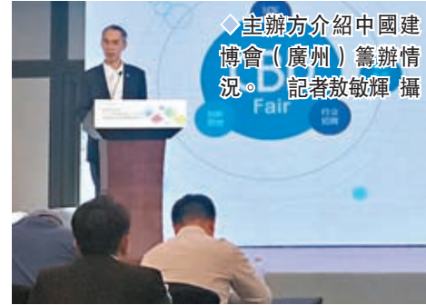
主辦方介紹中國建博會（廣州）籌辦情況。

面積約30萬平方米，參展企業超過1,200家，到場參觀和採購的專業觀眾達到12萬人。隨着疫情防控政策優化調整以及全面復常通關，今年建博會將進一步擴大，展會面積將增至50萬平方米以上，境內外參展企業和專業觀眾亦有望大幅提升。而本屆展會設定製、系統、智能、設計、材藝五大主題展區及衛浴博覽會，以定製主題展區面積最大，將覆蓋廣交會展館A、B兩個核心區域，規模超過20萬平方米。