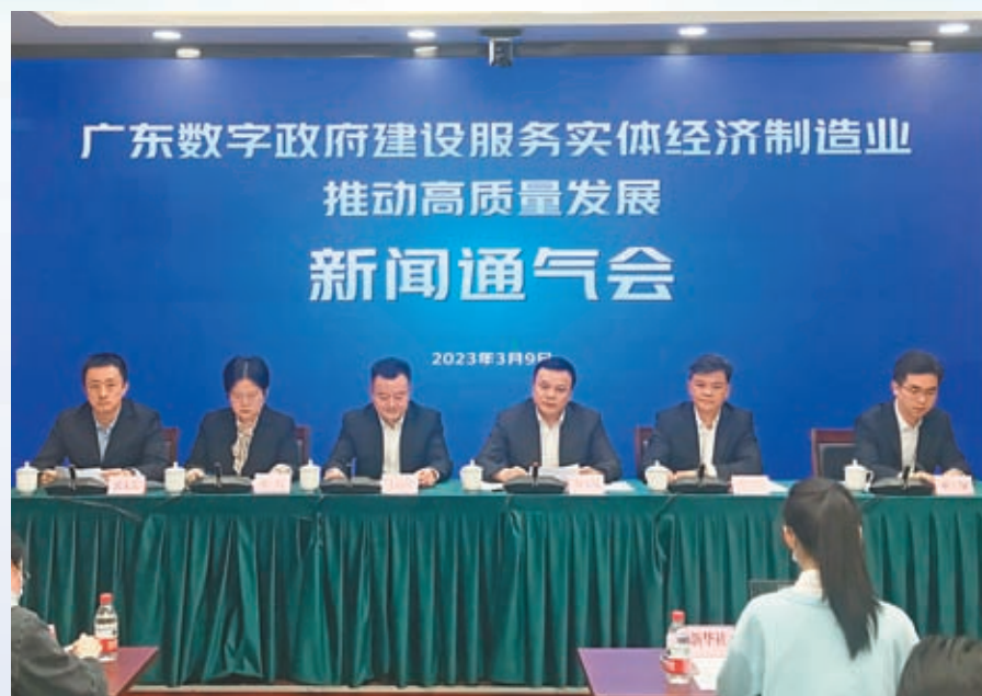
◆廣東省政務服務數據管理局負責人介紹新政亮點。