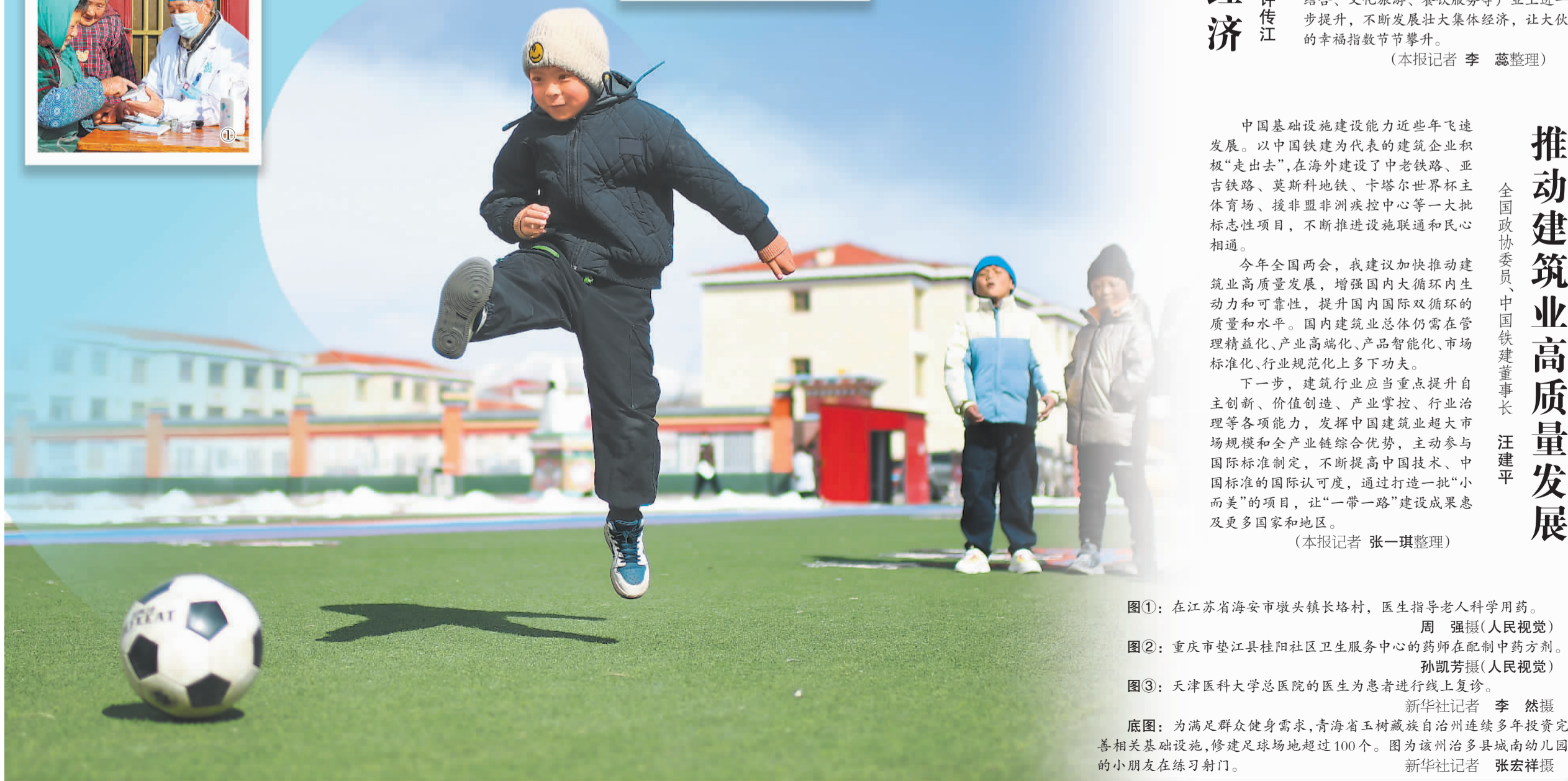
图①：在江苏省海安市墩头镇长塔村，医生指导老人科学用药。 图②：重庆市垫江县桂阳社区卫生服务中心的药师在配制中药方剂。 图③：天津医科大学总医院的医生为患者进行线上复诊。