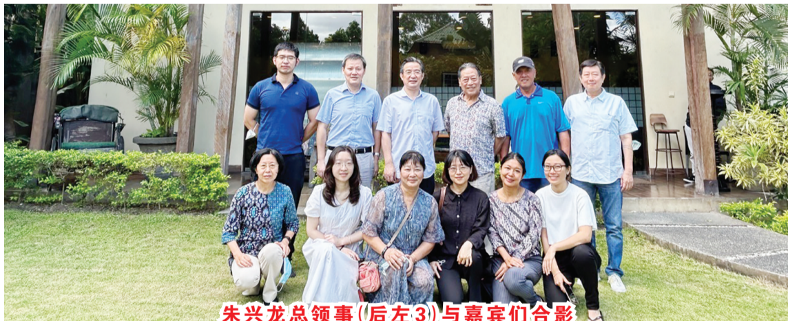
朱兴龙总领事(后左3)与嘉宾们合影

往巴厘岛及印尼其它各地的中国人所熟知和喜爱,也希望未来有更多的印尼咖啡豆走进中国市场,在两国咖啡产业结构的合作方面形成互补,发挥各自的优势,共促两国贸易的发展。