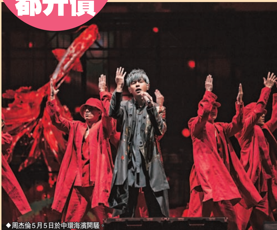
◆周杰倫5月5日於中環海濱開騷。

周董的香港演唱會原定三年多前舉行，受疫情影響一直延期，歌迷已守候多時，得知今年5月復辦的喜訊，非常雀躍。大會正努力呼籲持有舊票的歌迷盡快登記換領新票手續；更發現網上假飛及炒賣的問題非常嚴重！據知，有人向歌迷兜售炒飛價，每張比原價貴兩三倍；又有一些二