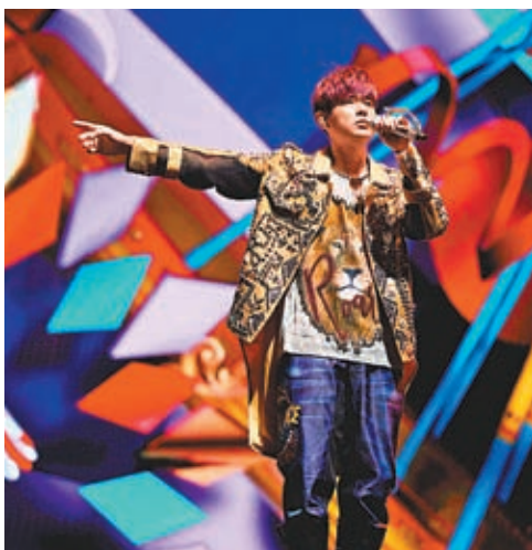
◆周董演唱會延期三年，歌迷已守候多時。