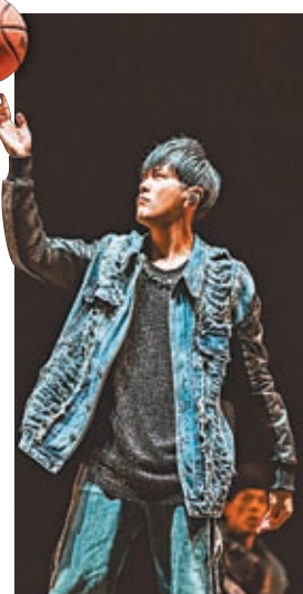
◆周杰倫演唱會門票瘋炒，歌迷稱如在炒股。

手網站，用一倍或以上價錢向持票的歌迷收購；還成為網民熱話，不少歌迷在網上討論指「周杰倫真心勁，演唱會票竟然等同股票，張飛持有三年，升值一倍以上」；「等咗三年呀，再升兩倍都唔賣」；「升兩倍我即放」，十分搞笑。