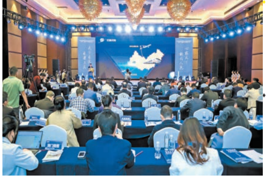
招商推介會現場。

【香港商報訊】記者馨瑤、陳彥濤報導：2023年來賓市走進粵港澳大灣區（深圳）招商推介會——來賓市工業園區（來賓高新區）專場昨日在深舉行。大會向粵港澳大灣區各界宣傳廣西來賓市投資環境，推介來賓市工業園區（來賓高新區）資源優勢，誠邀大灣區企業共享發展新機遇。7家企業在現場簽訂合作意向書，項目包括全球產業協同、LED智能顯示、分布式新能源儲能、智能製造產業園等。