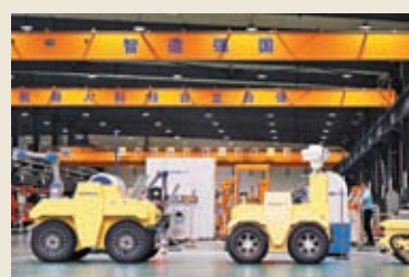
◆2022年，習近平考察瀋陽新松機械人自動化股份有限公司，強調必須走自主創新之路。圖為公司車間。網上圖片