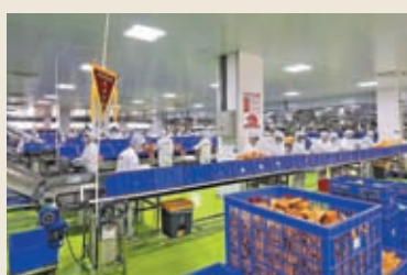
◆2021年，習近平到柳州螺蛳粉生產集聚區調研，鼓勵民營企業大膽地去發展。圖為柳州工人在包裝螺蛳粉。網上圖片