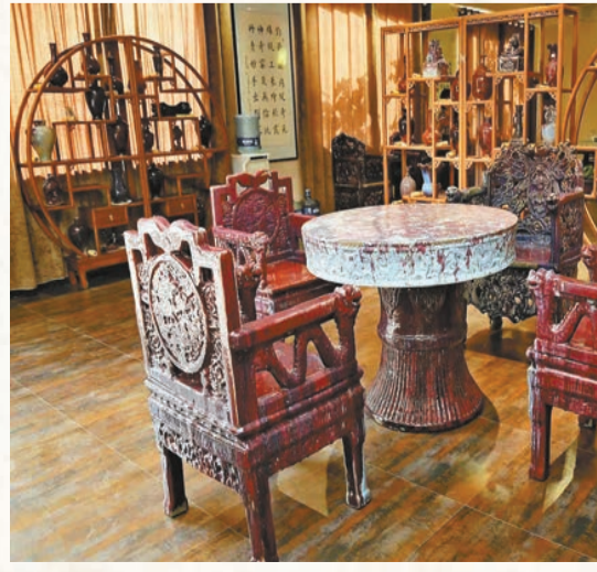
三代人共同創作品《鈞窯太師椅》