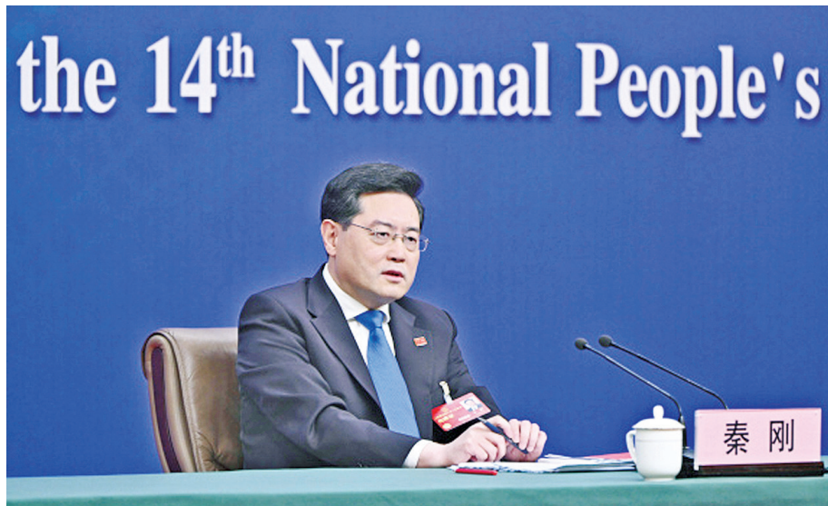
3月7日,十四届全国人大一次会议在北京梅地亚中心多功能厅举行记者会,外交部长秦刚就“中国外交政策和对外关系”相关问题回答中外记者提问。新华社记者 李鑫 摄

【本报记者张善萍北京专电】每年两会的外长记者会都是最受关注的。3月7日是秦刚作为新任外交部部长的身份首次亮相全国两会,300多位中外记者一大早,至少提前三、四小时在梅地亚中心门外排队。据观察,外媒记者占一半左右,可见世界对于这场外长记者会高关注度。在时长1小时50多分钟的记者会上,秦刚就“中国外交政策和对外关系”相关问题回答中外记者提问。问题聚焦中美关系、中俄关系、俄乌战争、一带一路等热点议题。