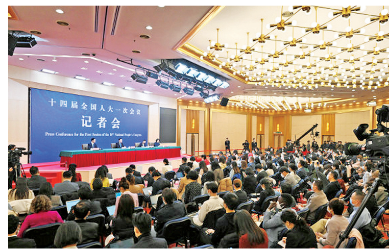
3月7日,记者会现场。

变成了陆联国,斯里兰卡普特拉姆电站点亮了万家灯火,蒙内铁路拉动了沿线经济增长超过2%,鲁班工坊使20多个国家的年轻人掌握了职业技能,中欧班列迄今已运行了65000列次,成为连通亚欧的钢铁驼队,运送抗疫物资的健康快车。今年,中方将举办第三届“一带一路”国际合作高峰论坛,我们将以此为契机,与各方一道推动共建“一带一路”取得更丰硕的成果。“一带一路”是务实开放的倡议,秉持的是共商、共建、共享原则,在合作中我们有商有量,在交往中我们重情重义,对于其他国家提出的倡议,只要不以意识形态划线,我们都欢迎,只要不夹带地缘政治的私货,我们都乐见其成。所谓“债务陷阱”这顶