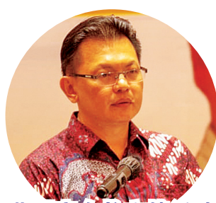
黄愿字会长主持活动