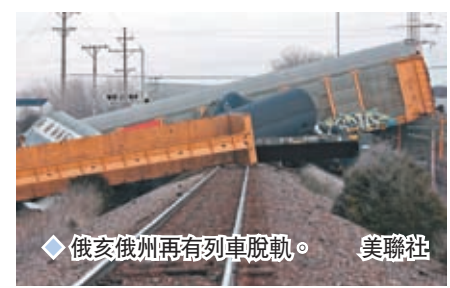
◆俄亥俄州再有列車脫軌。

美國國家運輸安全委員會其後公布東巴爾斯頓鎮「毒列車」事件初步調查報告，稱該事件「本可以預防」。在事發20天後，美國運輸部長布蒂格格才首次到訪事發地，遭共和黨人猛烈批評。 ◆綜合報道