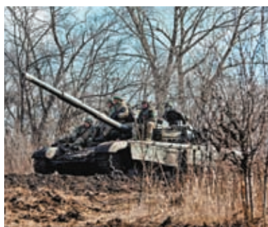
◆烏軍在巴赫穆特前線部署。

要橋樑被摧毀，其中包括連接該市至鄰近的恰西夫亞爾市最後一條主要補給線的一座橋樑，「現在烏控制下的出城補給路線愈來愈有限。」英方認為，烏軍在巴赫穆特「承受日益嚴峻的壓力」，隨着俄軍在巴赫穆特北部郊區繼續推進，烏控制的城區愈來愈受到來自俄軍的三面攻擊。 ◆綜合報道