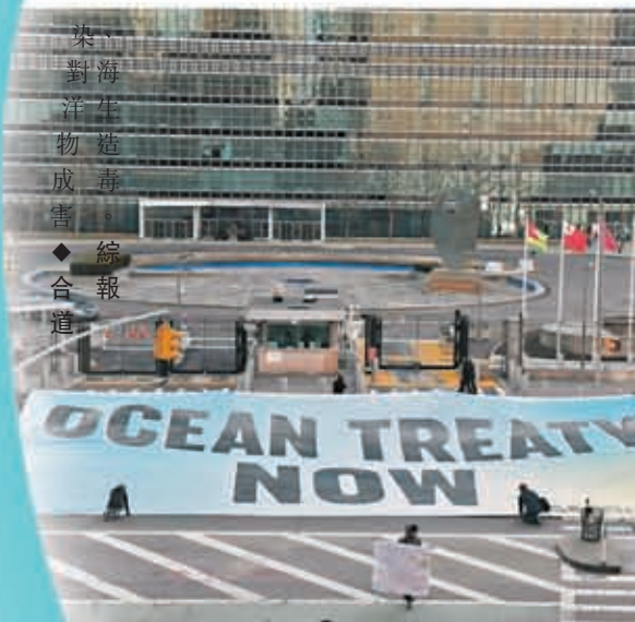
◆各國代表開會期間，環保組織在聯合國總部外拉起巨型橫額，呼籲達成協議。

據《科學》雜誌研究顯示，氣候變化導致海水升溫20倍，引發大規模生物死亡事件。IUCN海洋團隊負責人艾普斯表示，約四分之一的二氧化碳被海洋吸收，海水的酸性變強，導致某些物種的生存受到威脅，並進一步影響生態系統，目前約有41%的海洋生物受到氣候變化威脅。 ◆綜合報道