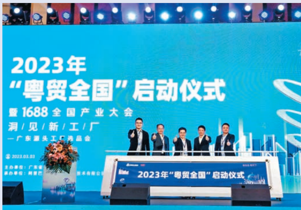
▲廣東省商務廳聯合阿里巴巴啟動「粵貿全國」行動，推動貿易回暖。