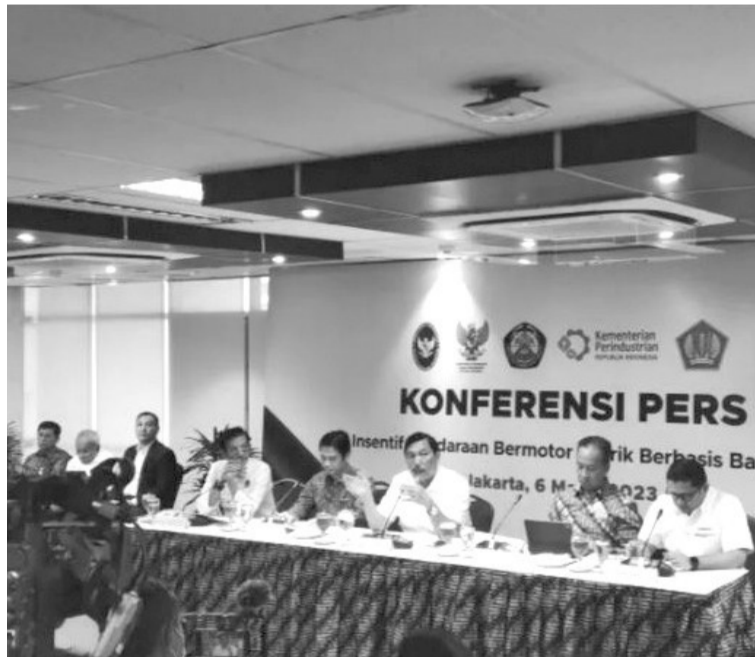
政府为电动汽车提供津贴 3月6日,海事与投资统筹部长卢虎(Luhut Binsar Pandjaitan)声称,希望通过电动汽车援助金或津贴可以招徕更多的投资。

位(Teus),其建设项目将维持到2037年,而且将分为三个阶段进行。除了扩建第二站之外,印尼港口公司也购买了供锡江新港使用的港口设备,有部分的设备也已经运来了,而且根据物流分配流量的增长,分阶段持续运进来。目前,现有港口的设备卸货能力,每年仅达100万集装箱标准单位。在2022年期间,锡江新港的物流业绩落实,每年近达80万集装箱标准单位。除此之外,锡江新港也有两层客运站,占地面积共约6608平方米,客运容纳量可达1500人。”(Sm)