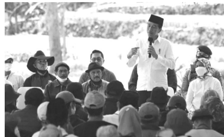
总统指示使用有机肥料解决化肥问题 3月6日,佐科维总统声称,使用有机肥料解决化肥短缺问题是最佳的选择。

口燃料的依赖性,同时也要实现印尼减少温室气体排放的承诺,加上制造电池的矿产资源或供KBLBB用的原材料也非常丰富。除此之外,推动KBLBB的发展,也能创造更多的就业机会和新技术,而且也可为国家增加可观的收入。卢虎补充说,如果政府对电动汽车所推动的援助纲领能顺利进行,希望电动汽车的价格能变得更加平价,并也能带动以可再生资源位处的汽车产业。”(Sm)