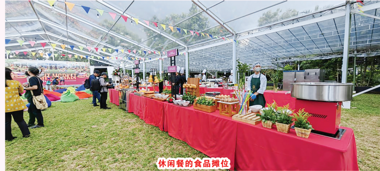
休闲餐的食品摊位