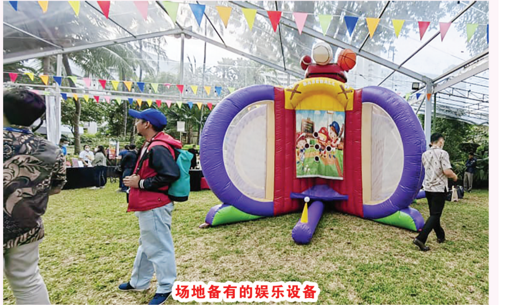
场地备有的娱乐设备