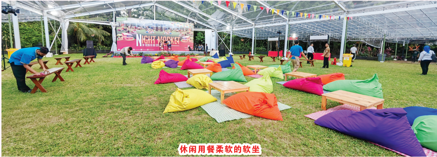
休闲用餐柔软的软坐