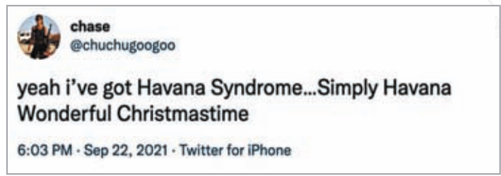
◆網民留言嘲諷「哈瓦那綜合症」。

美國政府連年炒作「哈瓦那綜合症」後，1日終於承認沒有任何證據顯示其與外國敵對勢力有關。事件在社交網絡上引來大批網民冷嘲熱諷，不少美國網民嘲諷稱引來連串調查的「哈瓦那綜合症」，恐怕只是外交官水土不服。還有人批評美國政府不過是以此為藉口，惡意攻擊其他國家。