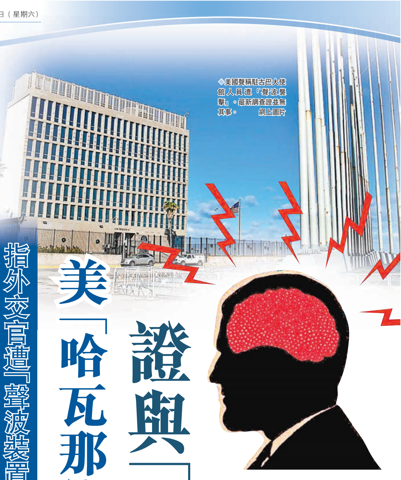
◆美國聲稱駐古巴大使館人員遭「聲波襲擊」。最新調查證並無其事。網上圖片

美國傳媒也不時配合炒作「哈瓦那綜合症」。有研究發現，如果在古巴等被美國視為「對手」的國家出現疑似個案，美媒報道就會暗示或明示這些國家涉嫌參與「攻擊」，需要為美方人員「健康受損」負責。但換作奧地利等與美國關係密切的國家，報道就會刻意忽略事件發生地點，反而轉移視線，將討論轉移至