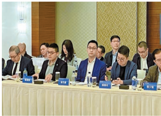
來自深圳、香港及澳門的相關官員、議員和業界代表百餘人聚首一堂，交流發言。

【香港商報訊】記者李銘欣報導：2023深圳國際漁業博覽會將於5月在深圳會展中心舉行。主辦單位深圳市鹽田港集團昨日假香港尖沙咀海濱嘉福國際酒店舉行推介會，來自深圳、香港及澳門的相關官員、議員和業界代表百餘人聚首一堂，交流意見，為把大灣區海洋產業做大做強出謀獻計。