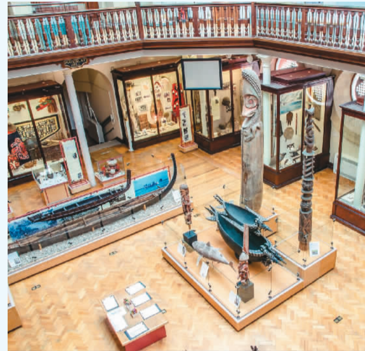
剑桥大学考古与人类学博物馆内的莫兹利厅（Maudslay Hall）。

在博物馆里驻足、漫步，真的如同乘坐时空旅行机，穿梭于世界各地的过去与当下。或是由于人类学背景的关系，这里展陈的分类标准更专业，注重物件之间的联系及其背后的整体社会环境，因而每进入一个小的展区，就好像走进了那个时空。博物馆工作人员也非常重视历史与当下的关联，比如，一个展柜中陈列着不同年代、不同地域的人们利用自然材料制作的手工艺品，暗含着人与自然的和谐、人与人之间的共美。