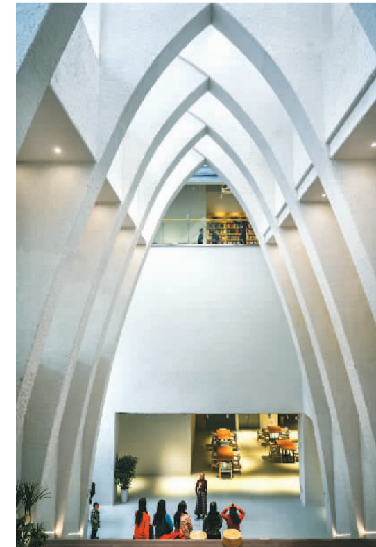
湖南省长沙市岳麓区谷山，隐身在森林里的几何书店艺术感十足。