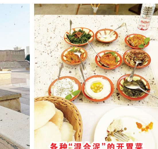
各种“混合泥”的开胃菜