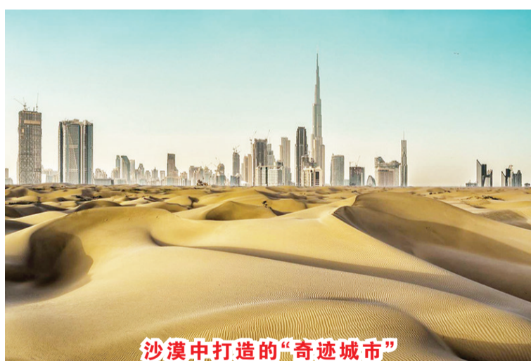
沙漠中打造的“奇迹城市”

终于有时间好好静下心来写一些关于迪拜行程的感受。由于和行程出发前朋友说“仅是一个土豪的阿联酋”相比，与现实中的目睹和感受形成太强烈的反差，因此一直在寻找提笔入口的“感觉点”。作为全球商业和未来经济的枢纽，抬头仰视一排排的摩天大楼和正在建盖的楼房，迪拜利用其自身的天际线和空中轮廓在短時間內向全世界呈现了世界无数个“第一”：首家3D打印办公楼、精致至极的人工岛、世界唯一一家七星级酒店、室内水族馆、滑雪的购物中心、跳伞及全世界最昂贵的赛马等，难以置信20多年前几乎仅为一片沙漠。一下飞机，满眼所及的色彩就是黑和白，当然伊斯兰教作为中东地区普遍的宗教信仰也是众人皆知，但其实世界上穆斯林人口最多的国家则是我刚乘机出发的国家—印尼。男士妇女从头到脚穿着长袍拖至地面，使得我穿着刚过膝的长裙都感觉有些不自在；还好行李箱中备着几条长裙，迪拜2月初也正逢白天平均温度仅20—24度，晚上还嗖嗖凉的“冬季”，赶紧掏出来换上挡风保暖。