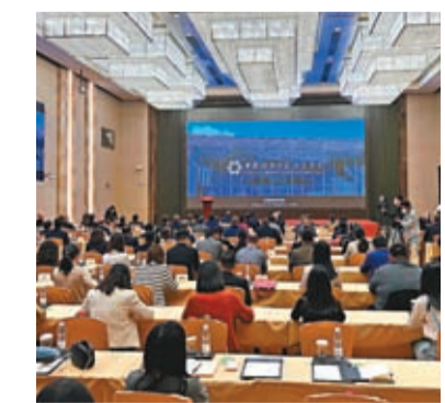
第133屆廣交會2月28日舉辦推介會，宣布全面恢復線下展。

專區，在保持16大類商品類別的基礎上，展區總數達到54個，專區總數達到159個，全面展示產業發展最新水平和科技進步最新成果。值得注意的是，本屆將首次在第一期、第二期、第三期三個展期均設立進口展區，所有商品類別全部面向境外企業開放。目前，德國、西班牙、意大利等國際優秀企業參展活躍，土耳其、韓國、印度、馬來西亞等國家將組團參展。同時，中國頗具採購實力的連鎖企業，如華潤萬家、卜蜂蓮花、蘇寧易購、名創優品等踴躍參會。