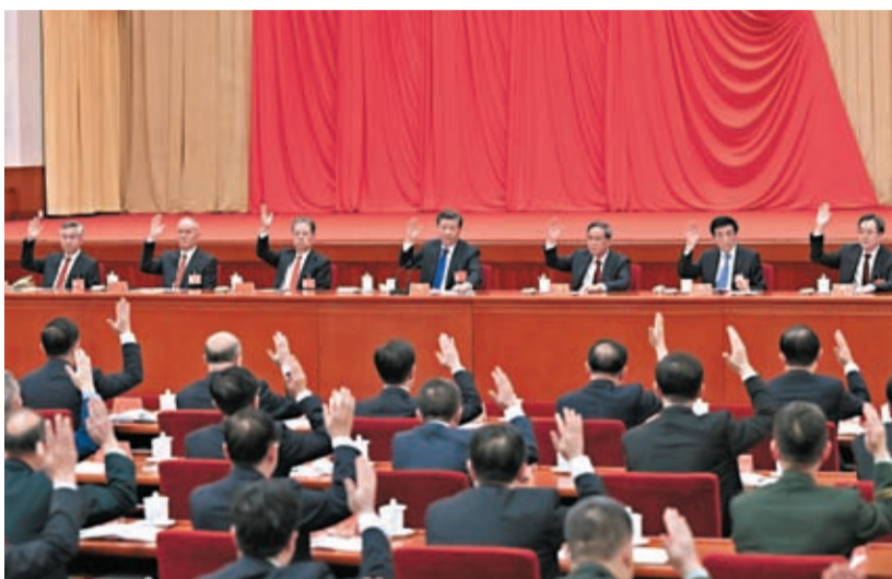
中共二十屆二中全会2月26日至28日在北京舉行。圖為習近平、李強、趙樂際、王滬寧、蔡奇、丁薛祥、李希等在主席台上。

全會聽取和討論了習近平受中央政治局委託作的工作報告，審議通過了中央政治局在廣泛徵求黨內外意見、反覆醞釀協商基礎上提出的擬向十四屆全國人大一次會議推薦的國家機構領導人選建議名單和擬向全國政協十四屆一次會議推薦的全國政協領導人選建議名單，決定將這兩個建議名單分別向十四屆全國人大一次會議主席團和全國政協十四屆一次會議主席團推薦。審議通過了在廣泛徵求意見基礎上提出的《黨和國家機構改革方案》。習近平就《黨和國家機構改革方案（草案）》向全會作了說明。全會同意把《黨和國家機構改革方案》的部分內容按照法定程序提交十四屆全國人大一次會議審議。