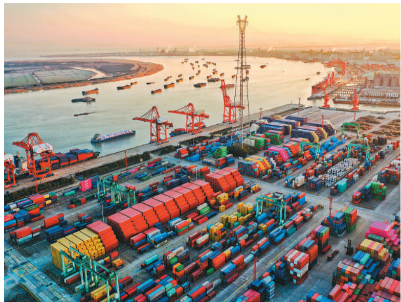
近日，在长江张家港段，一艘艘装载生产生活物资的船舶在江面上往返穿梭，港口呈现一派繁忙景象。

本报北京2月28日电（记者廖睿灵）国内生产总值超121万亿元，再次跃上新台阶！国家统计局28日发布的2022年国民经济和社会发展统计公报显示，2022年，中国国内生产总值1210207亿元，比上年增长3%。