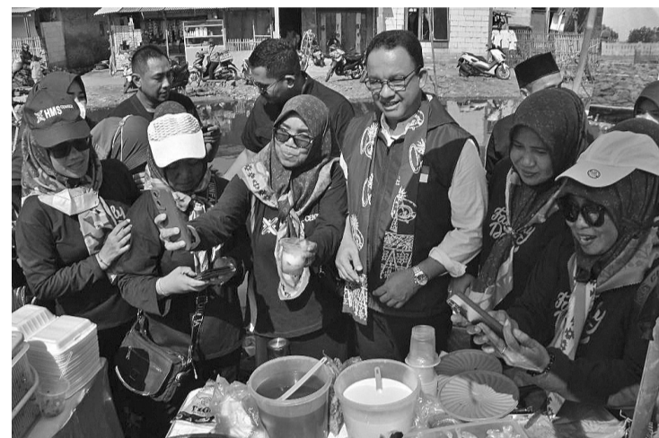
前雅加达专区省长阿尼斯

【本报讯】2月28日，民族民主党副秘书长塔斯林(Hermawi Taslim)表示，他确定阿尼斯总统候选人将继续由佐科维总统运营的计划。其中之一是，将首都迁往东加里曼丹的政策。因为迁都的计划已在2022年第3号关于新国都的法规有所规定，法律法规中包含的政策，无论总统是谁人，包括若阿尼斯当选，都将延续这一政策。这是受法律法规的保护，没有理由不继续法律规定的一切。