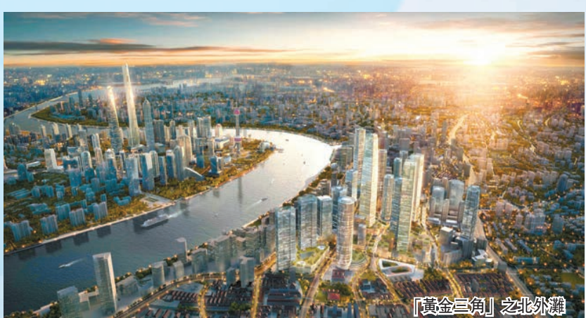
「黃金三角」之北外灘