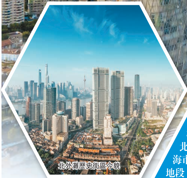
北外灘歷史街區今貌