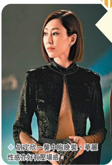
◆胡定欣一襲中胸晚裝,華麗性感亦好好有壓場感。