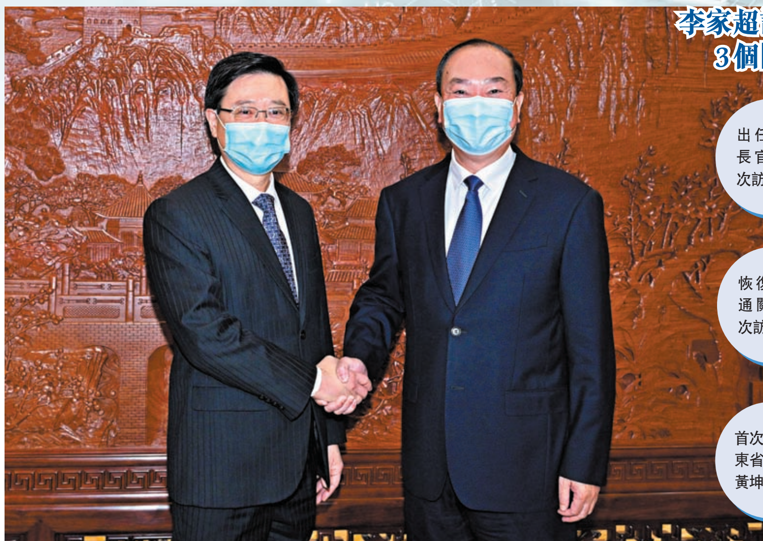
李家超訪穗深 3個「首次」

李家超在會見記者時，被問到香港與廣東在未來的發展中可有什麼互動？他表示，廣東的願景是建設「新廣東」，而香港是開新篇，認為兩個「新」的概念有幾個相似的地方，包括大家都需要高質量發展，認為從高質量發展推動新氣象是廣東與香港的共識，科技應用、綠色生活、新能源，以及超越三地現有法律限制等一些超前做法，均是大家在新領域、新氣象、新願景方面的共同目標，也是大家同意在不同領域方面共同推動的一個起點。