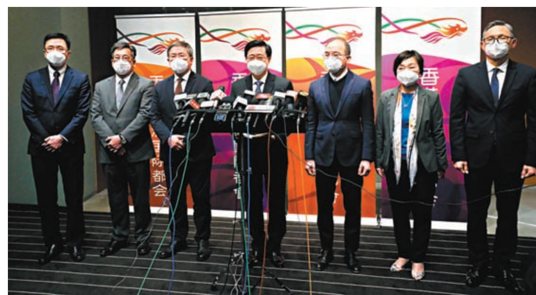
◆香港特區行政長官李家超23日率團到訪廣州和深圳。圖為李家超與代表團成員在廣州會見傳媒。

開展之後一系列不同領域、涉及不同官員及不同人士的交流計劃，通過這些訪問，可以表明香港會積極和主動融入大灣區發展建設並作出貢獻，同時讓特區政府內部的同事和其他社會人士知道香港在大灣區建設方面所重視的一些領域。