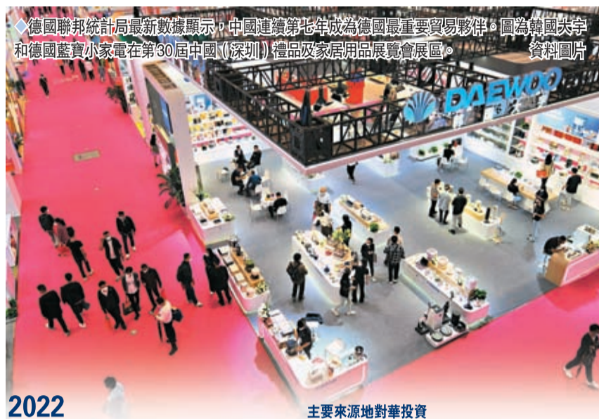
2022 中國與主要貿易夥伴的貿易額創歷史新高

英國國家統計局2月17日發布的數據顯示，2022年，中國是英國貨物進口方面第二大貿易夥伴，貨物出口方面第五大貿易夥伴。英國杜倫大學學者張志權認為，受貿易多元化需求驅動，英國對華出口增加。英國商界正在積極推動英中經貿往來，今年雙邊貿易有望進一步增長。