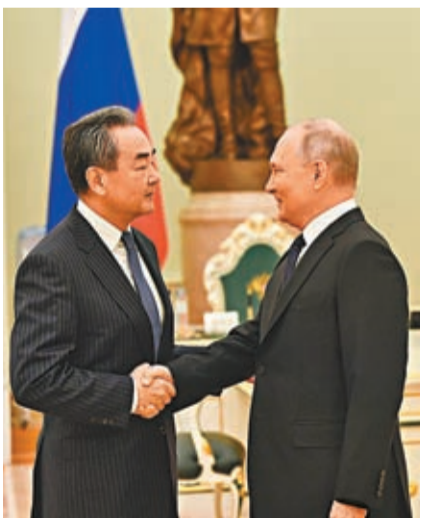
當地時間2月22日，俄羅斯總統普京在莫斯科會見中共中央政治局委員、中央外事工作委員會辦公室主任王毅。

香港文匯報訊 據外交部網站消息，當地時間2023年2月22日，俄羅斯總統普京在莫斯科會見中共中央政治局委員、中央外事工作委員會辦公室主任王毅。